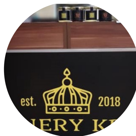
VINOTÉKA WINERY KRAL