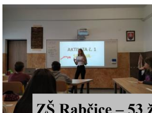
ZŠ Rabčice – 53 ž.