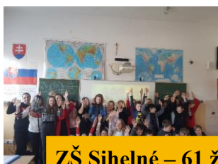
ZŠ Sihelné – 61 ž.