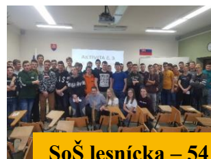
SoŠ Iesnícka – 54 ž.

Školenie „Šikana a kyberšikana alebo zodpovedne na internete.“ OTIDEA s. r. o.