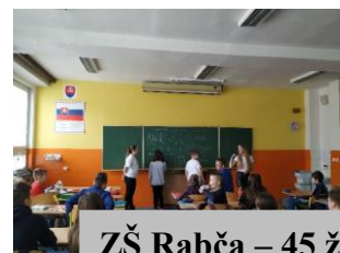
ZŠ Rabča – 45 ž.