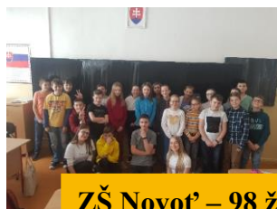
ZŠ Novot' – 98 ž.