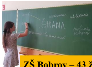
ZŠ Bobrov – 43 ž.