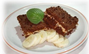
TVAROHOVÝ SWEET TIME