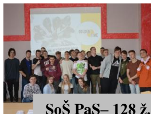
SoŠ PaŠ – 128 ž.