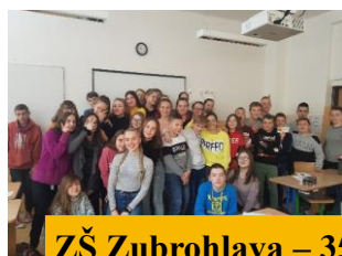
ZŠ Zubrohlava – 35 ž.