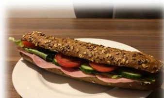
FIT - BAGUETTE