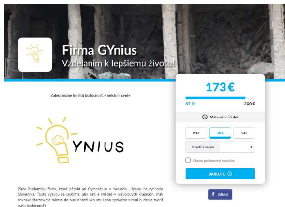
Internetová stránka našej fundraisingovej výzvy