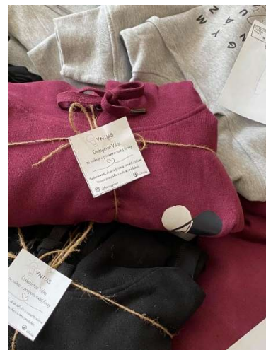
Mikiny pripravené k odovzdaniu