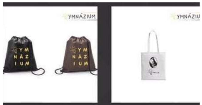
Originály návrhov vakov a tašiek