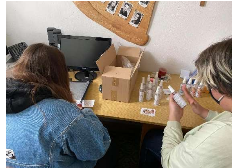
Kompletizácia dezinfekčných prípravkov