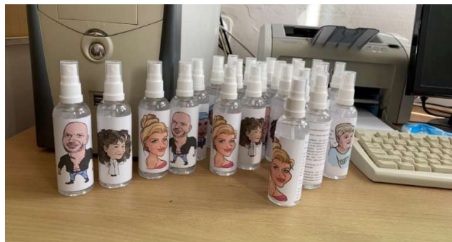
Dezinfekčné prípravky s karikatúrou