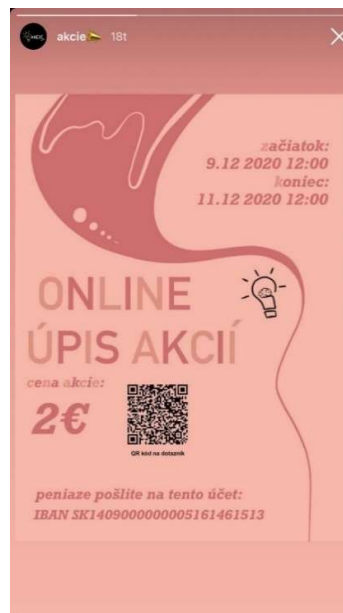
Plagát úpisu akcií