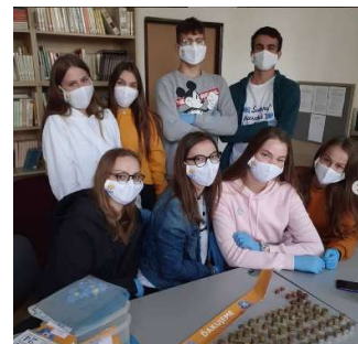
Zbierka ku Dňu Nezábudiek - Liga za duševné zdravie