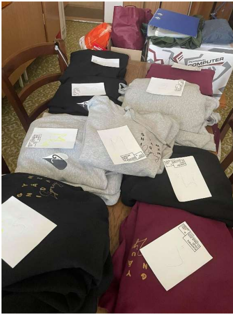
Príprava a finalizácia mikín