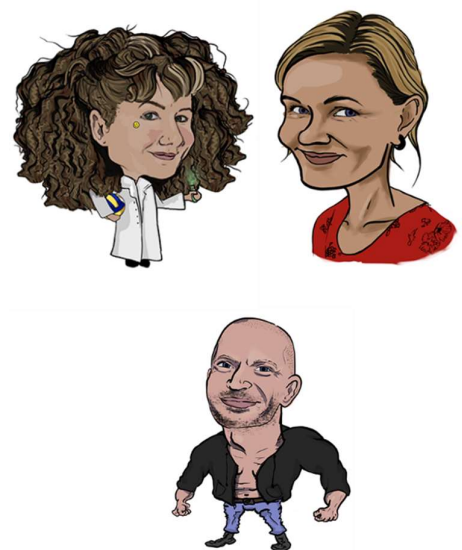
Výber z karikatúr našich učiteľov