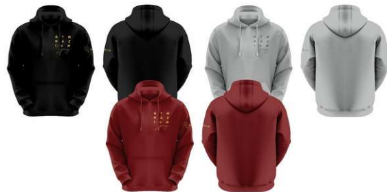
Originály našich návrhov