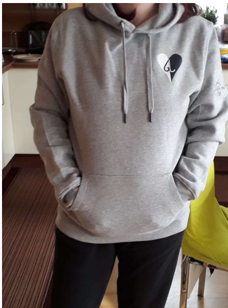
Náš spokojný zákazník