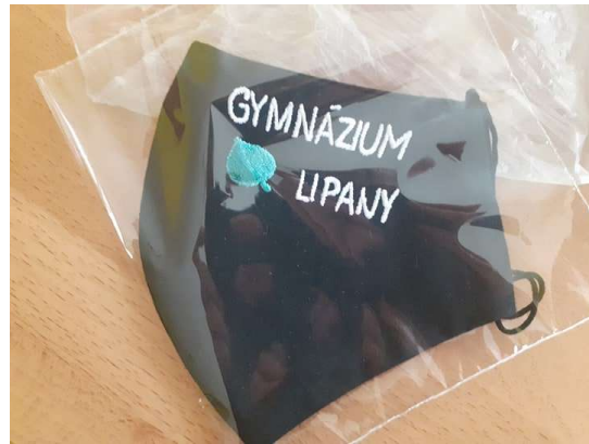
Ručne šité a vyšívané rúška, sterilne balené