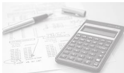
Tabuľka č. 1