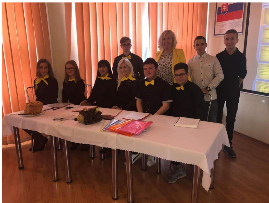
Jeden z našich produktov - bábovka