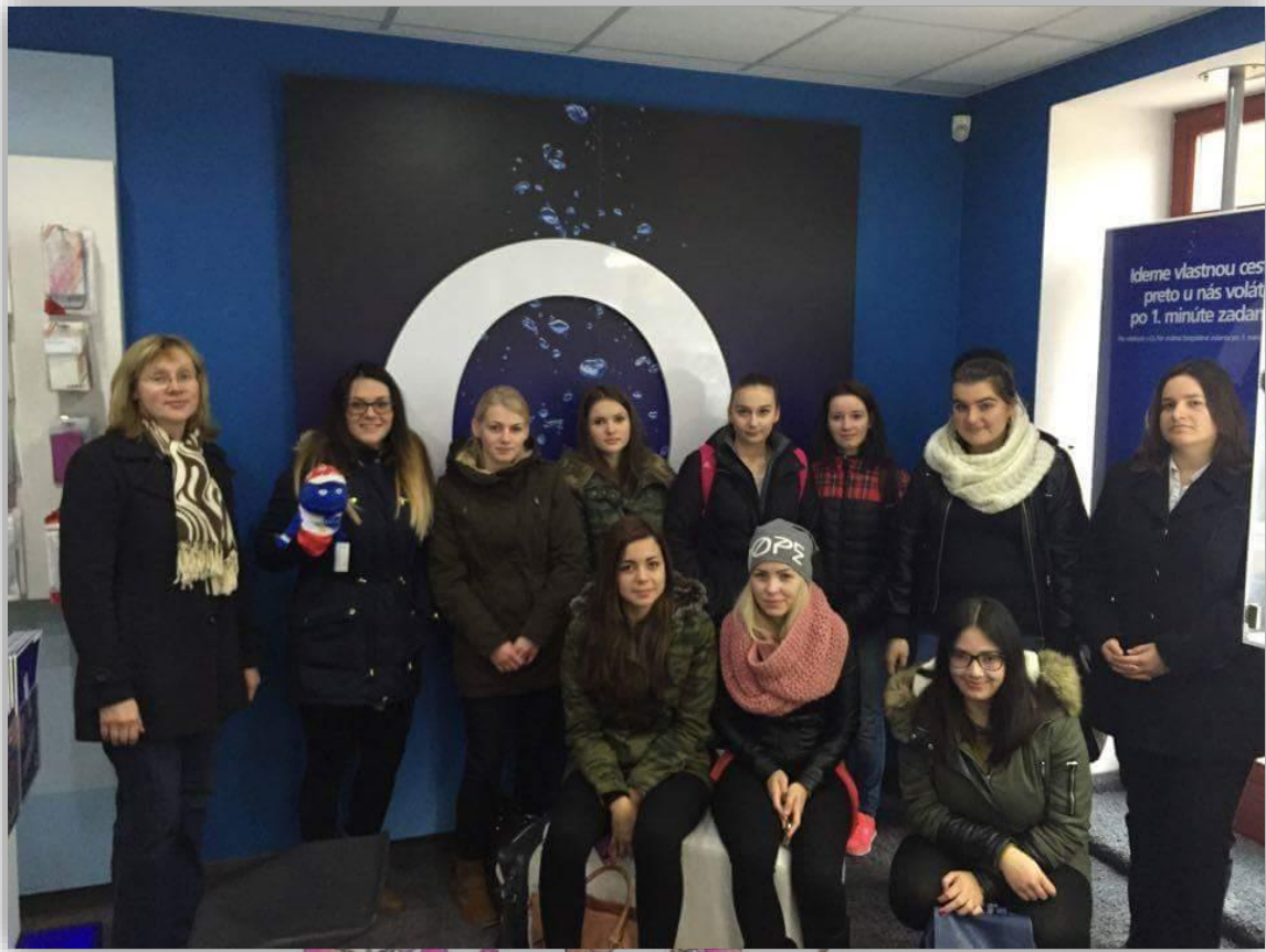
Foto: Zamestnanci firmy pri odovzdaní mobilov v rámci zbierky Srdce pre deti