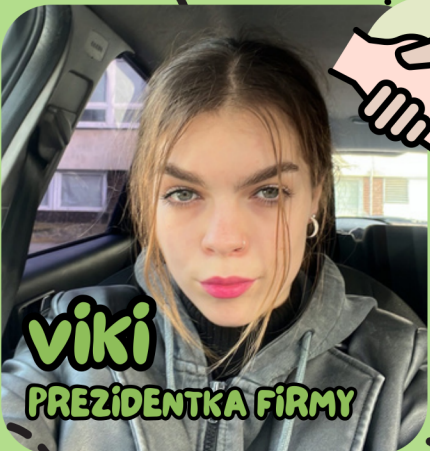
VIKI PREZIDENTKA FIRMY