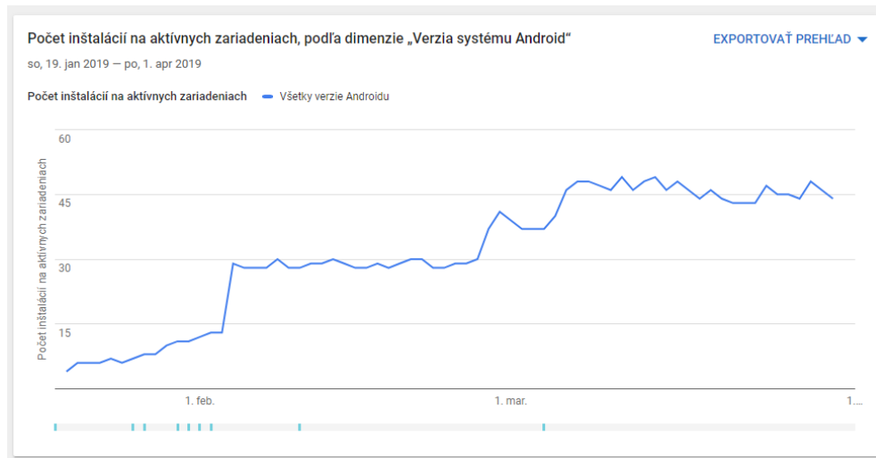
Graf inštalácií na systéme Android

Keksobox však nie je limitovaný iba na predaj jedla alebo školské prostredie. Je možné ho využiť na predaj a distribúciu prakticky ľubovoľných produktov. Naša firma ho preto poskytuje ako službu pre ostatné firmy.