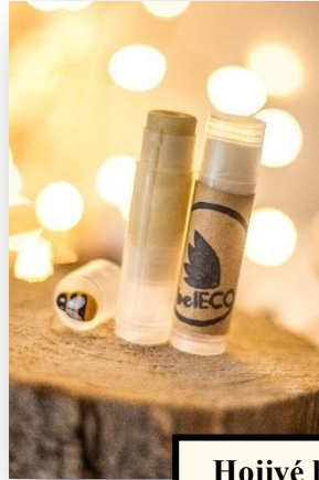
Hojivé balzamy s propolisom