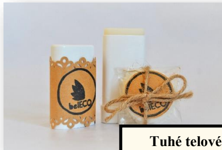
Tuhé telové mlieko