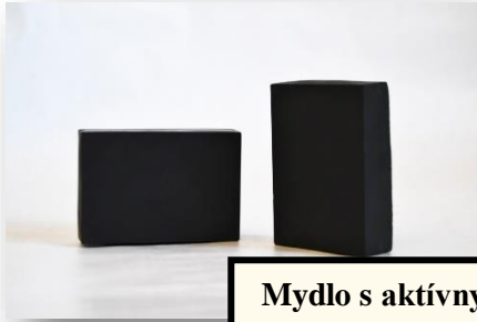
Mydlo s aktívnym uhlím – náš najväčší úspech