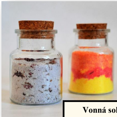
Vonná soľ s relaxačným účinkom