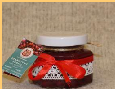
Granátový profil granátové jablko

Zákazníci sa môžu presvedčiť o dôveryhodnosti našich produktov, pretože na každom obale je uvedený dátum výroby aj spotreby, presný zoznam ingrediencií, z ktorých sa čaj skladá a návod na použitie čaju.