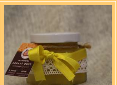
Zdravý duch pomaranč a zázvor