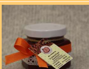
Vianočná radosť granátové jablko a škoricca