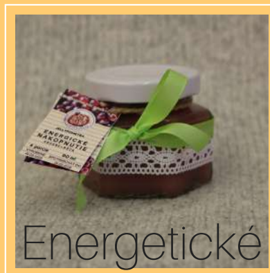
Energetické nakopnutie hrozno a mäta

Pretože nepridávame sladidlá ani konzervanty, ponúkame nefalšovanú chuť prírody a to až v piatich variantoch: