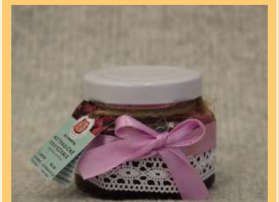
Netradičné osvieženie cvikla a jablko